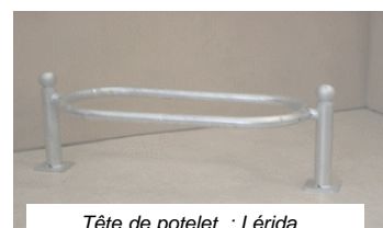
Tête de potelet : Lérída