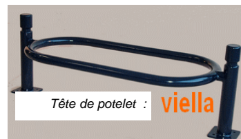
Tête de potelet : viella