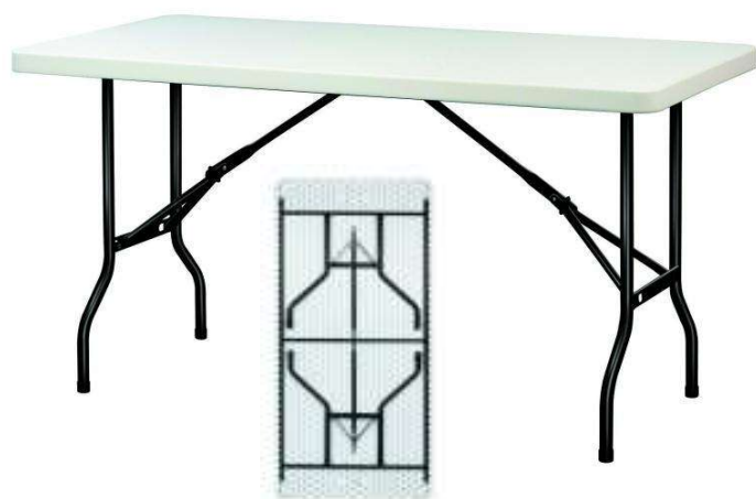
Table pliante Regina