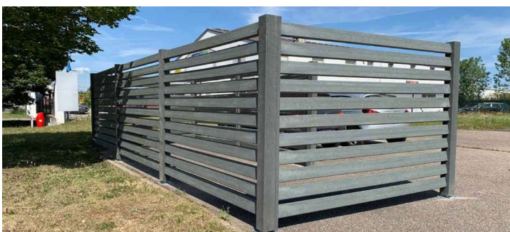
Photo non contractuelle : 8 lames et non 11 comme présenté ci-dessus

Nous consulter Le cout de transport dépend des quantités et du département de livraison.